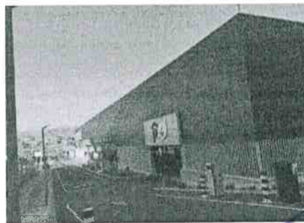
Fachada lateral de 06:00 a 14:00 H

Limcamar® Limpieza y Servicios Avda. Tierno Galván 7 Edificio Limcamar 30100 El Puntal, Murcia Telf: 968 28 13 13 Fax: 968 28 07 19